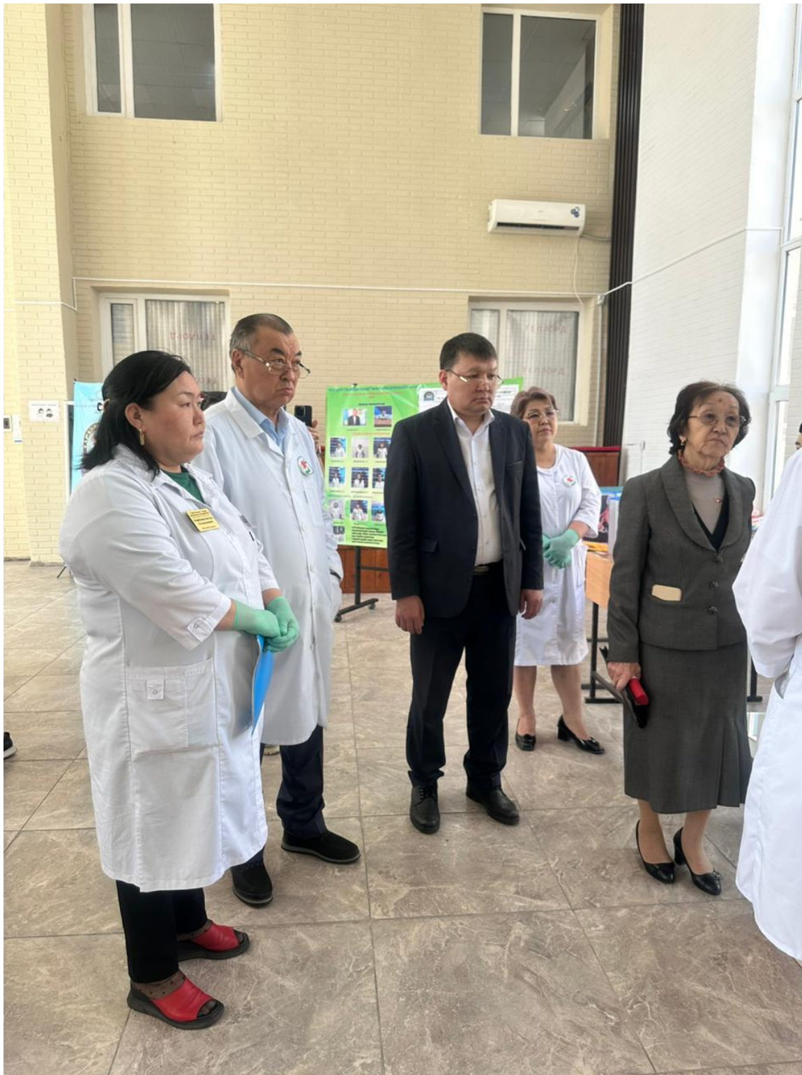
«Мейіргер ісі», «Қолданбалы бакалавр» мамандықтар пәндерінің онкүндік іс-шарасының ашылуы

Ақпараттық оқыту технологиясы, инновациялық оқыту технологиясы, түрлі ойын және дамыту технологиясы студентті кешенді әдістемелік құралдарымен, медициналық муляждармен және манекендермен, робот симуляторлармен жұмыс жасатып көрсетіп, тәжірибелік дағдыны оқытуда білім берудің озық тәсілдерін қолдануды, курстан курсқа өткен сайын күрделі дағдыларды игеруді, оқу үдерісіндегі ақпараттық-әдістемелік және материалды-техникалық базаны үздіксіз жетілдіріп үйретуді көрсетті.