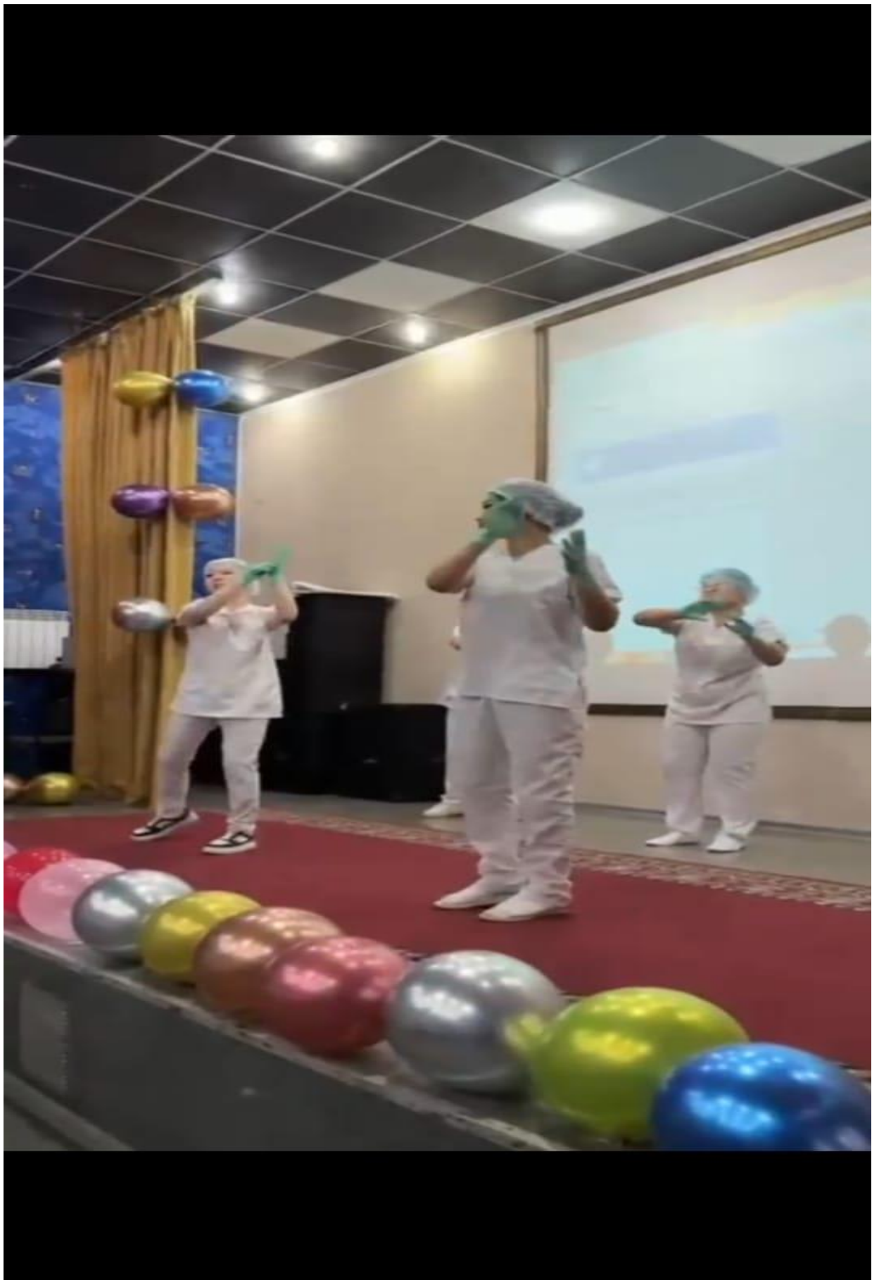
Флешмоб қол жуу әдісі тазалық кепілі