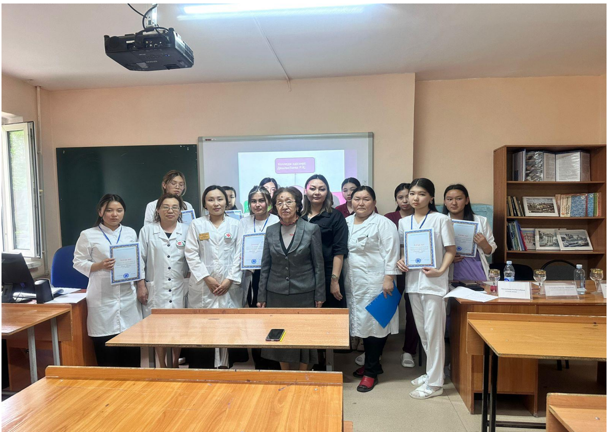
Олимпиядадан бас жүлде алған студенттерді марапаттау